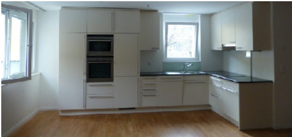
Mutschellenstr. 130, 8038 Zürich