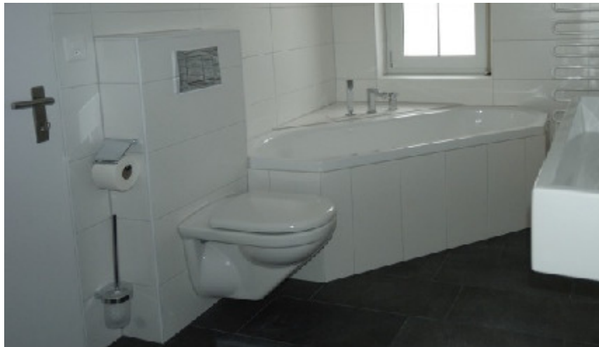
Glockengasse 18, 8001 Zürich