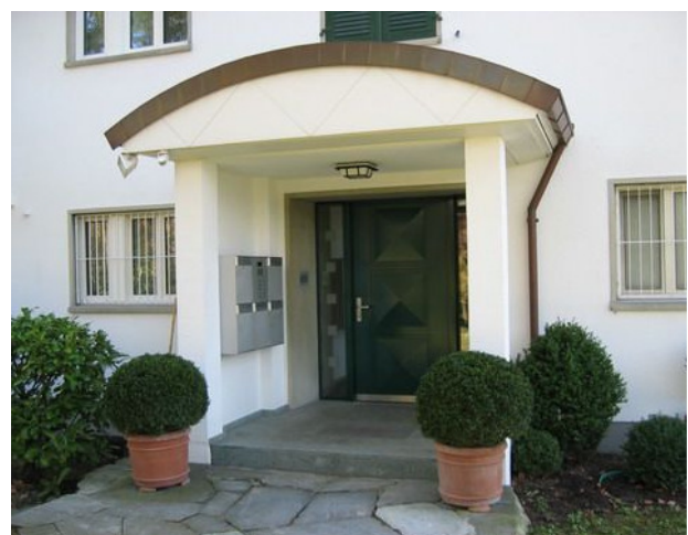
Kurfürstenstr. 69, 8002 Zürich