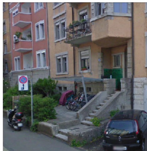
Lindenbachstr. 36, 8006 Zürich