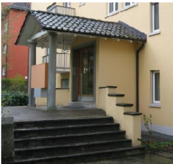
Winterthurerstr. 16, 8006 Zürich