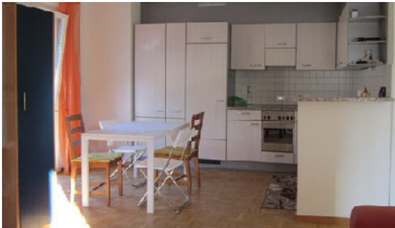
Wehntalerstr. 113, 8057 Zürich