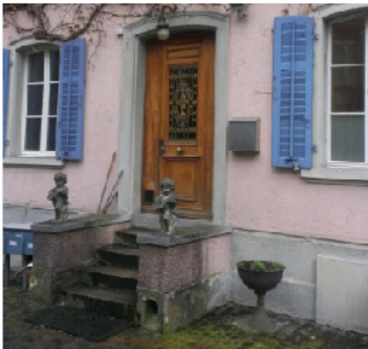
Gerechtigkeitsgasse 31, 8001 Zürich