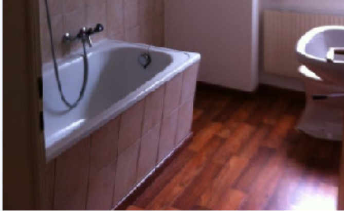
St. Georgenstr. 118, 9011 St. Gallen